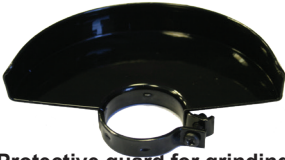
Protective guard for grinding.