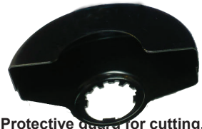
Protective guard for cutting. (Not included in the equipment.)