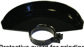
Protective guard for grinding.