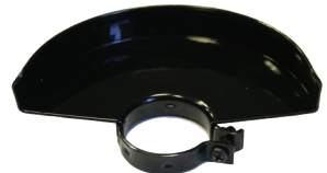
Zaščitni pokrov za brušenje.

*Prikazan ali opisan pribor ne spada v standardni obseg dobave.