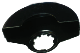
Garda de tăiere (nu este furnizat).