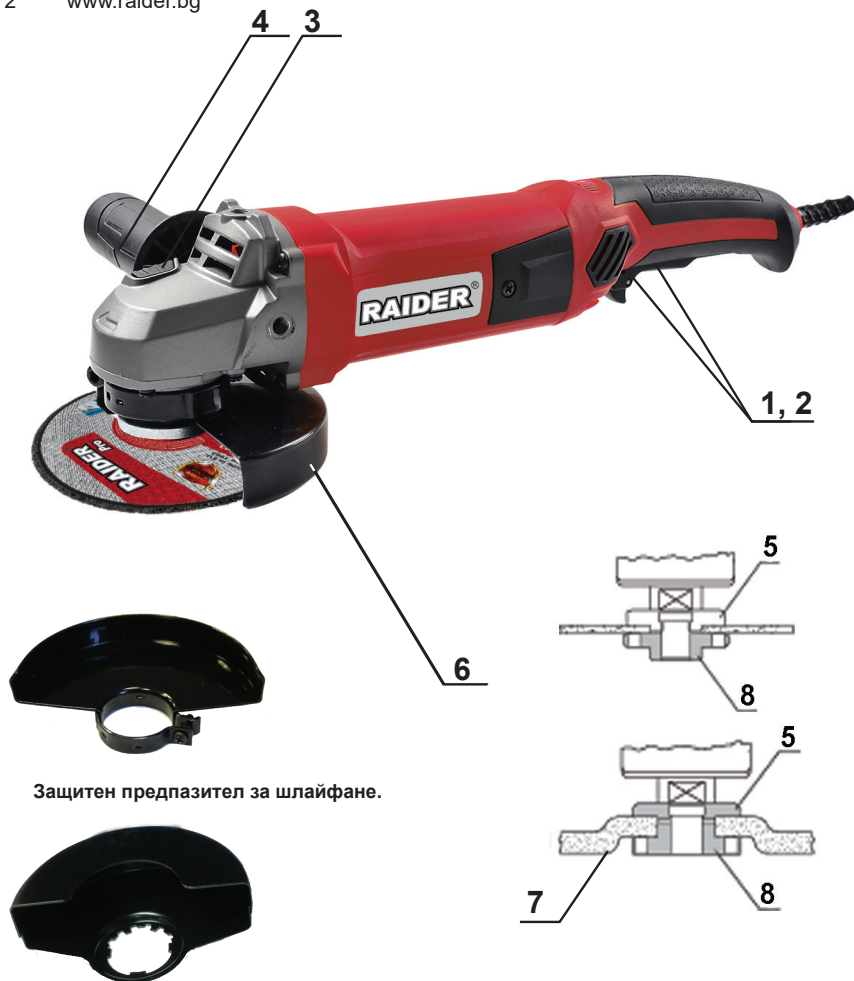
Защитен предпазител за шлайфане.